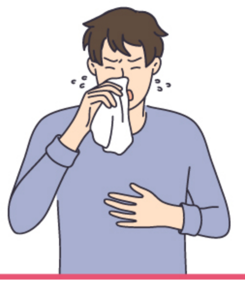
Sa lubhang nakakahawa na panahon magkakaroon ng ubo, sipon, pamamaga at pangangati ng mata, maliliit na batik sa loob ng bibig atbp.