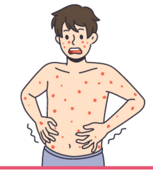
Lumalabas ang mga mapupulang pantal sa likod ng leeg, sa ilalim ng tainga, katawan, mga braso at binti, sa mga kamay.talampakan