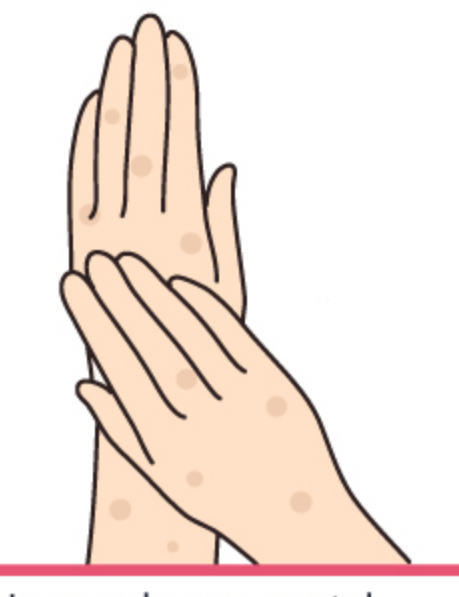
Nawawala ang pantal, nag-iwan ng skin pigmentation